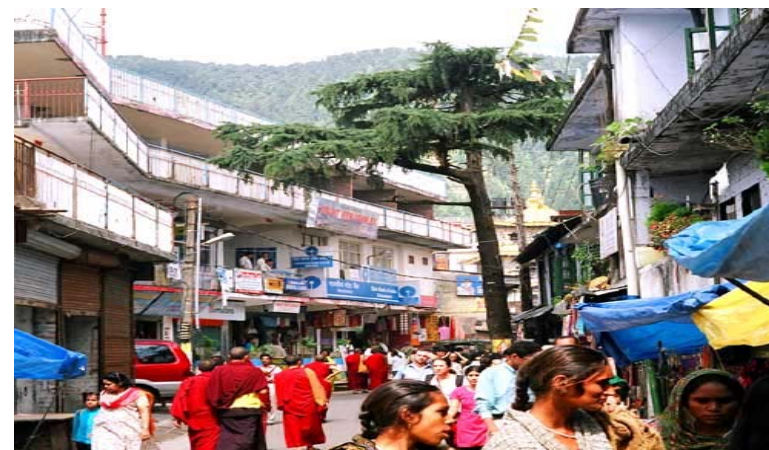
Phố xá của Tiểu Lhasa 5

Ganj, vì thế nơi đây được gọi là “tiểu Lhasa”, tức là thủ đô Lhasa nhỏ của Tây Tạng. Hiện nay có hơn 120.000 dân sắc tộc Tây Tạng sinh sống tại đó, cũng có khoảng 20,000 chur tăng ni và 200 tu viện được xây dựng như tu viện Tsuglagkhang (trú xứ của Đức Đạt Lai Lạt Ma), tu viện Dip-Tse-Chokling, Nechung, Gadong, Namgyalma, Tushita vv... Hàng ngày có hàng ngàn Phật tử từ các nước Âu-Mỹ, Nga, Nhật Bản, Đại Hàn, Đài Loan, Ấn Độ đến đây để làm từ thiện, dạy tiếng Anh, tham dự khóa tu, hành thiền và nghe pháp thoại. Tiểu Lhasa còn có những đặc sắc như có nhiều khu phố mua bán, dịch vụ, trưng bày các pháp cụ, tượng Phật bằng đá quý hay gỗ trầm, chuỗi niệm Phật, những bức tranh Thangka, những công trình điêu khắc gỗ, tác phẩm thủ công mỹ nghệ, thảm thêu, tranh lụa, nữ trang, y phục sắc tộc Tây Tạng vv... Ngoài ra những bệnh viện, trường học, thư viện, bảo tàng, những khu vườn trà, những cánh rừng bao quanh triền núi, rừng thông già xứ tuyết yên tĩnh, chinh phục núi tuyết, đêm lửa trại trên cao, ngắm phong cảnh tại Dharamshala và cộng đồng người dân Tây Tạng ngụ cư chất phác vv... đã thu hút nhiều du khách đến đây để viếng thăm và chiêm ngưỡng. Chỉ cách thủ đô Delhi 514 cây số (km), nên Dharamsala cũng có các tiện nghi hiện đại đáp ứng nhu cầu khách chiêm bái du ngoạn như có phi cơ, xe lửa, xe buýt, taxi, phục vụ; nhiều khách sạn, nhà hàng đã được mọc lên trên những sườn núi khiến cho Tiểu Lhasa thực sự nhộn nhịp và ngày càng phát triển sinh động.