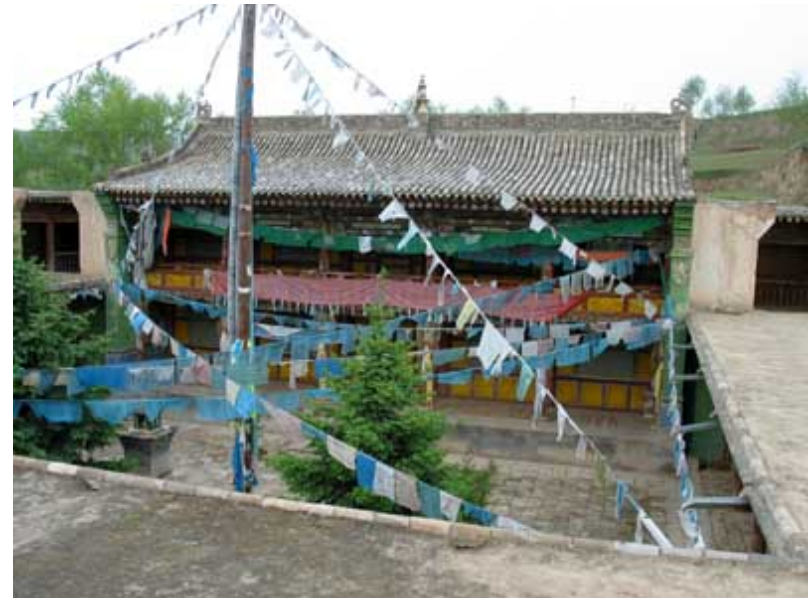
Ngôi nhà nơi Đức Đạt Lai Lạt Ma thứ 14 ra đời 6

tháng 07 năm 1935 trong một gia đình nông dân nghèo tại một ngôi làng nhỏ vùng Takster thuộc miền Đông Nam, tỉnh Amdo, Tây Tạng. Lhamo Dhondup nghĩa là Hoàn thành ý nguyện của Nữ Thần (Wish-Fulfilling Goddess) là tên thời thơ ấu của ngài. Lúc lên 2 tuổi, ngài được công nhận là hoá thân của Thubten Gyatso, Đức Đạt Lai Lạt Ma thứ 13 và ngài được đưa về thủ đô Lhasa để chính thức làm lễ tấn phong là Đức Đạt Lai Lạt Ma thứ 14