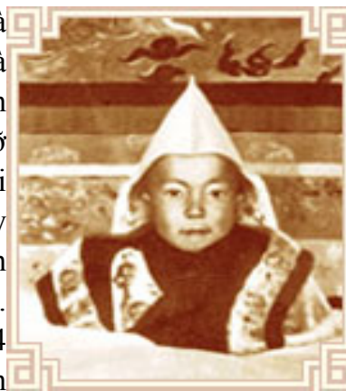
Đức Đạt Lai Lạt Ma lúc 3 tuổi

Cách lỗ (Gelugpa). Sau đó, cậu bé Lhamo Dhondup được đưa về tu viện Kumbum. Vị Lạt Ma thứ 14 tí hon này lúc đầu cũng rất buồn và nhớ song thân, anh chị em và bạn bè của mình, nhưng cũng may là có sư huynh của ngài là Lobsang Samten đã ở tu viện Kumbum trước đó, giúp đỡ ngài và thầy giáo thọ của ngài là một vị thầy già chuyên dạy học cho các chú sadi hình đồng cũng rất tốt và vui tính. Cuối cùng, vị Lạt Ma thứ 14 cùng với gia đình và tăng đoàn về đến thủ đô Lhasa.