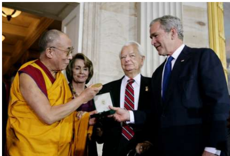
Cựu Tổng Thống Geogre W. Bush trao Huy Chương Quốc Hội Hoa Kỳ (Congressional Gold Medal) lên Đức Đạt Lai Lạt Ma vào ngày 17 tháng 10 năm 2007 (bên trái là Bà Nancy Pelosi, Ông Nghị viện Robert Byrd and Tổng thống Mỹ George W. Bush)

Tóm lại, Tenzin Gyatso, Đức Đạt Lai Lạt Ma thứ 14 là một hóa thân Bồ tát, một người đã suốt đời hy sinh thân mạng mình để mang lại an lạc và hạnh phúc cho con người. Ngài đã xuất hiện như một định mệnh để thừa kế dòng tái sinh huyền bí của trường phái Cách lỗ (Gelugpa) Mũ Vàng. Ngài đã giữ tước vị Đức Đạt Lai Lạt Ma, Nguyên thủ quốc gia Tây Tạng, trong một giai đoạn bấp bênh nhất trong lịch sử Tây Tạng. Hiện nay, vẫn trong thân phận người tị nạn lưu vong, tuy nhiên, ngài rất lạc quan và hạnh phúc trong sứ mạng đem ánh sáng Phật