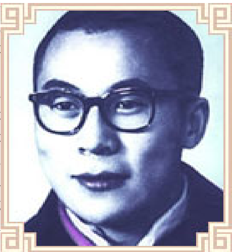
Đức Đạt Lai Lạt Ma Tenzin Gyatso lúc trưởng thành

Đức Đạt Lai Lạt bắt đầu sự nghiệp tu học của mình vào lúc 6 tuổi. Ngài được đưa vào các tu viện chuyên đào tạo các vị Lạt Ma tại thủ đô Lhasa. Ngài nhập chúng ở tu viện Jokhang để thể phát xuất gia, đắp y như một chú đệ tử và bắt đầu hành sự tu tập với pháp danh là Jamphel Ngawang Lobsang Yeshe Tenzin Gyatso, nói gọn là Tenzin Gyatso.