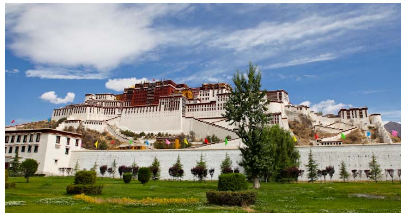
Cung điện Portala ở Lhasa, Tây Tạng cao 13 tầng với một ngàn phòng và mười ngàn miếu thờ và lăng mộ của tám vị Đạt Lai Lạt Ma.

ngài, kinh thành tạm thời giữ kín việc ngài nhập tịch cho đến khi kinh thành xây xong. Do đó, ngày nay cung điện Potala trở thành một biểu tượng tâm linh vĩ đại của Lobsang Gyatso, Đức Đạt Lai Lạt Ma thứ 5.