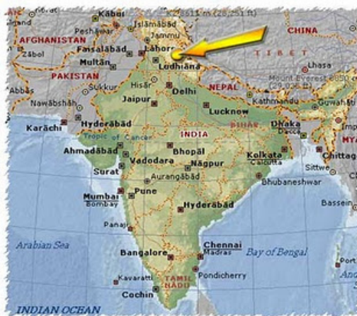
Dharamsala trong bản đồ Ấn Độ

Ngày 17 tháng 3 năm 1959, đức Đạt Lai Lạt Ma đời thứ 14 Tenzin Gyatso, vị lãnh đạo tinh thần của xứ này cùng với Ban thiền Lạt ma rời thủ đô Lhasa, và cư ngụ tại cao nguyên Dharamsala, thuộc bang Himachal Pradesh, Ấn Độ.