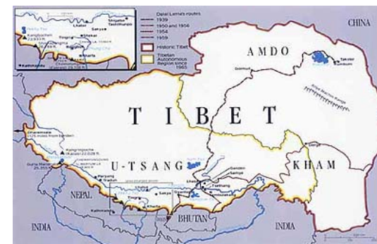
Bản đồ Tây Tạng 2

Một trong các vị Lạt-ma quan trọng nhất là ngài Tông Kha ba (Tsongkhapa), được mệnh danh là "nhà cải cách", bởi lẽ ngài thiết lập và tổ chức lại toàn bộ các tông phái. 2