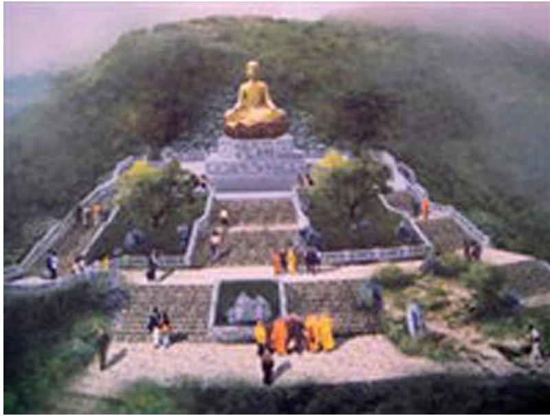
Phối cảnh tượng đài

đồng liền khối (nguyên liệu nhập từ Úc), nặng khoảng 100 tấn, cao 9,9 m.