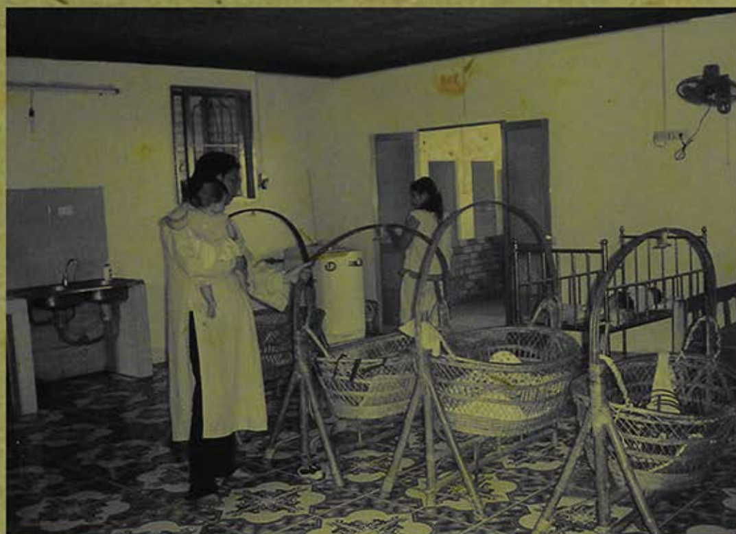
Nhà Tình Thương chùa Diệu Pháp (Đồng Nai). (Ảnh chụp năm 2008)