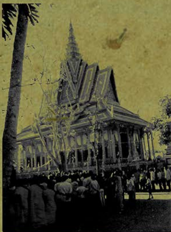
Lễ kiết giới seima chùa Trà Nóc (xã Song Lộc, H.Châu Thành, tỉnh Trà Vinh) ngày 22/3/2009. (Ảnh chụp năm 2009)