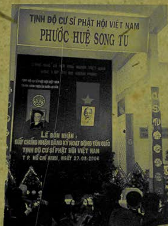
Lễ cấp giấy đăng ký hoạt động cho Tỉnh Độ cư sĩ Phật hội Việt Nam, mỗi chùa là cơ sở hốt thuốc từ thiện miễn phí. (Ảnh chụp năm 2006)