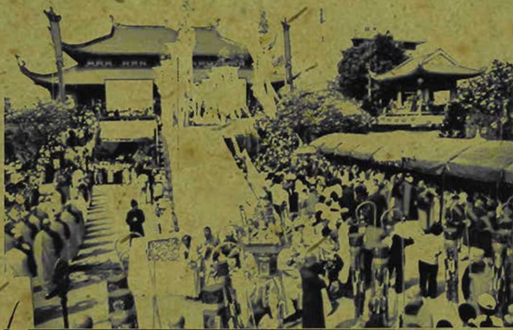
Đại trai đàn chẩn tế chùa Vĩnh Nghiêm. (Ảnh chụp năm 2007)