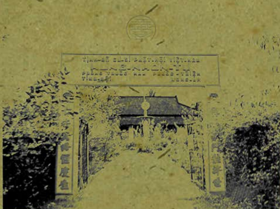
Hung Nhơn Tự, chùa có phòng thuốc Nam phước thiện, tỉnh Long An. (Ảnh chụp năm 2008)