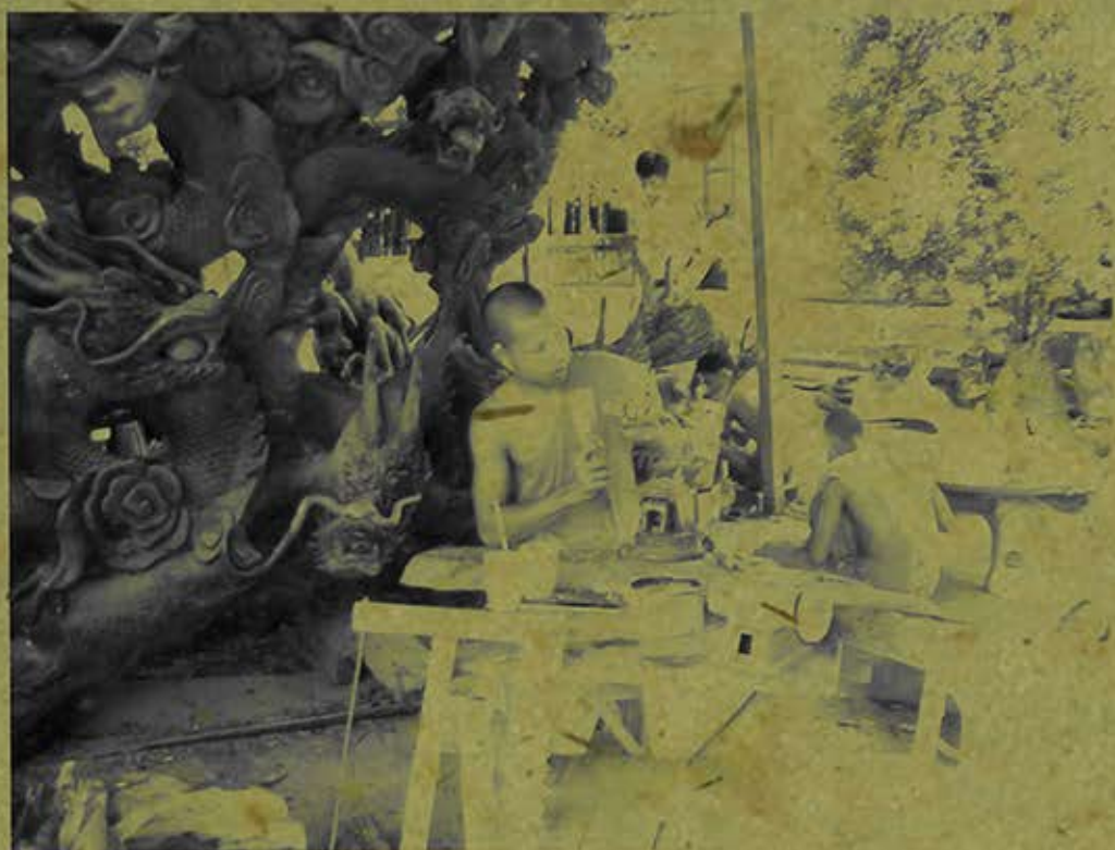
Chạm khắc tượng gỗ trong chùa Hang (Trà Vinh). (Ảnh chụp năm 2009)