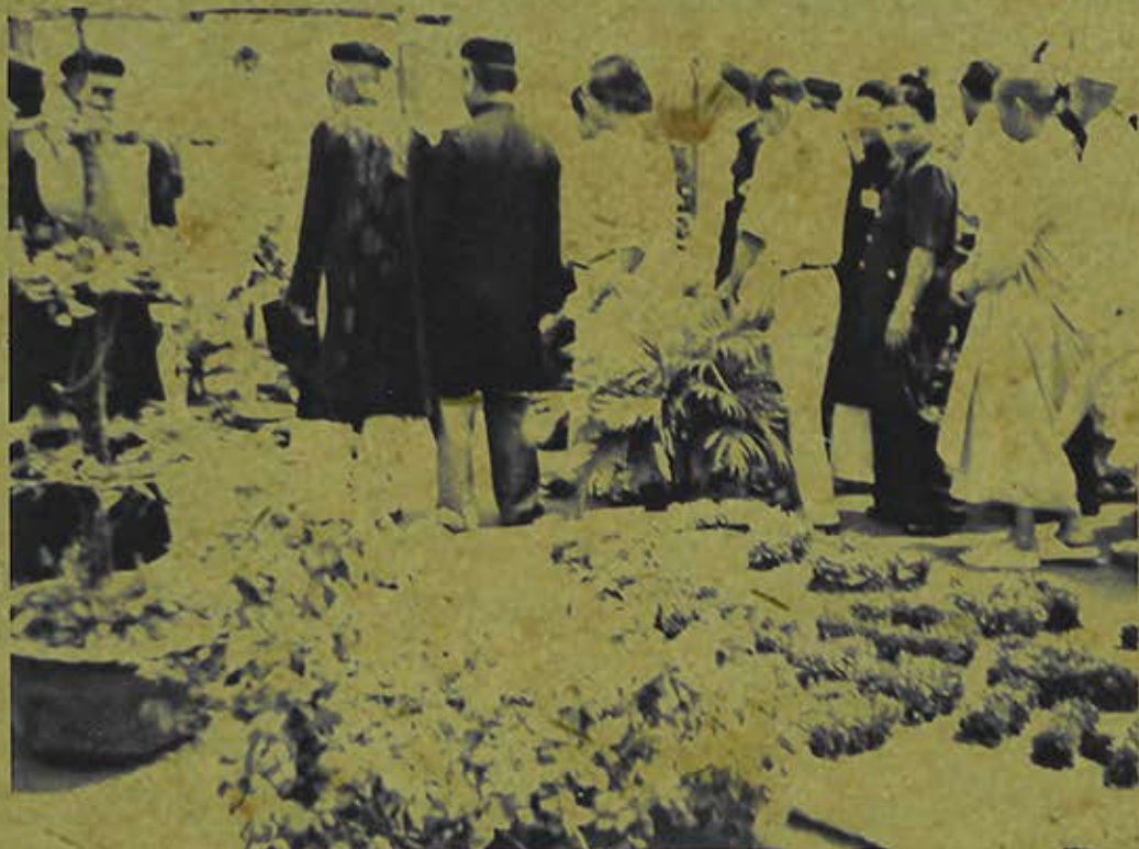
Triển lãm vườn thuốc Nam của Tịnh Độ cư sĩ Phật hội Việt Nam tại Tổ đình Hưng Minh Tự (2006)