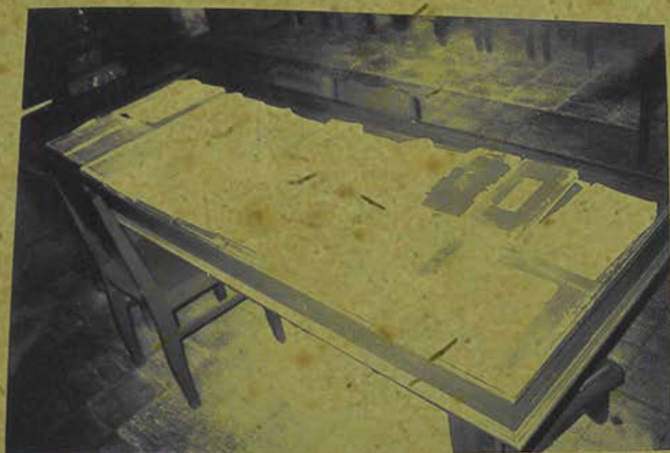
Kinh sách chữ Hán đang lưu giữ tại chùa Bửu Lâm (Đồng Tháp). (Ảnh chụp năm 2008)