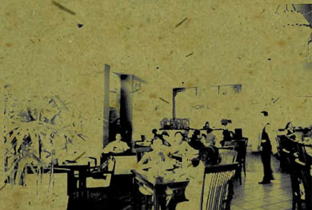
Quán chay Hoa Đăng ở Thành phố Hồ Chí Minh (website: http://www.nigioingaynay.com )