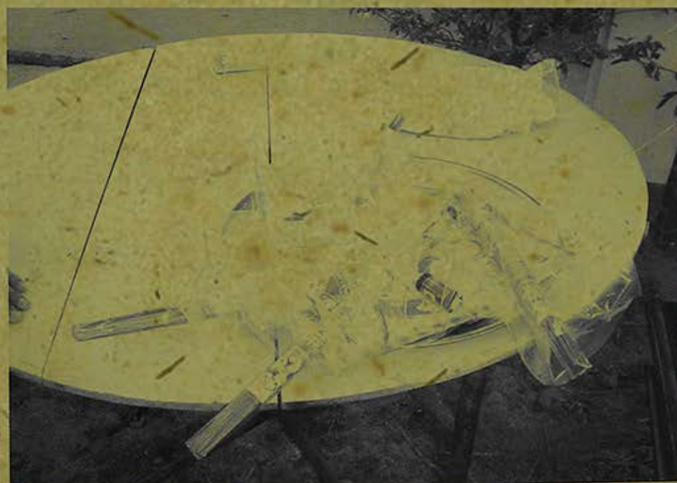
Lễ vật bày bán trong ngày lễ kết giới seima chùa Trà Nóc (xã Song Lộc, H.Châu Thành, tỉnh Trà Vinh) ngày 22/3/2009. (Ảnh chụp năm 2009)