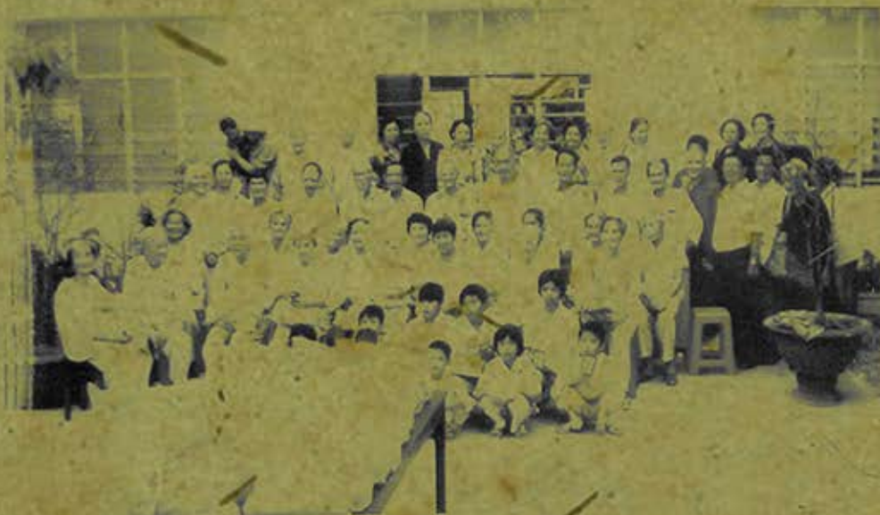
ĐOÀN TỬ THIÊN XÃ HỘI ĐẾN THĂM VÀ TẶNG QUÀ QUÝ CỤ GIÀ CÔ ĐƠN & TRẺ MỒ CÔI TẠI TRUNG TÂM NUÔI DƯỠNG NGƯỜI GIÀ CÔ ĐƠN & TRẺ MỒ CÔI THỊ XÃ CHÂU ĐỐC.

Đoàn từ thiện xã hội Phật giáo tặng quà cho trẻ em khuyết tật H.Châu Phú, Tỉnh An Giang. (Ảnh chụp năm 2007)