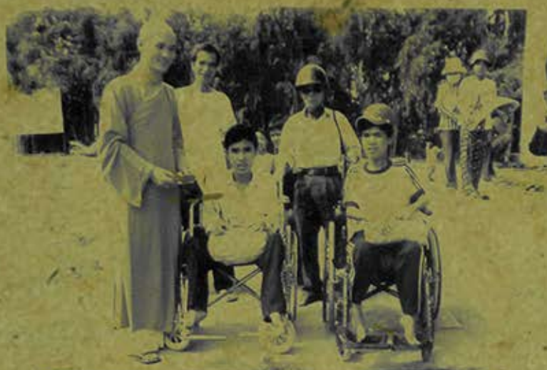
ĐOÀN TỬ THIÊN XÃ HỘI TẶNG QUÀ CHO CÁC EM KHUYẾT TẬT NHÂN NGÀY TẾT NGUYÊN ĐÁN TẠI XÃ BÌNH PHÚ - HUYỆN CHÂU PHÚ - TỈNH AN GIANG

Đoàn từ thiện xã hội Phật giáo tặng quà cho trẻ em khuyết tật H.Châu Phú, Tỉnh An Giang. (Ảnh chụp năm 2007)