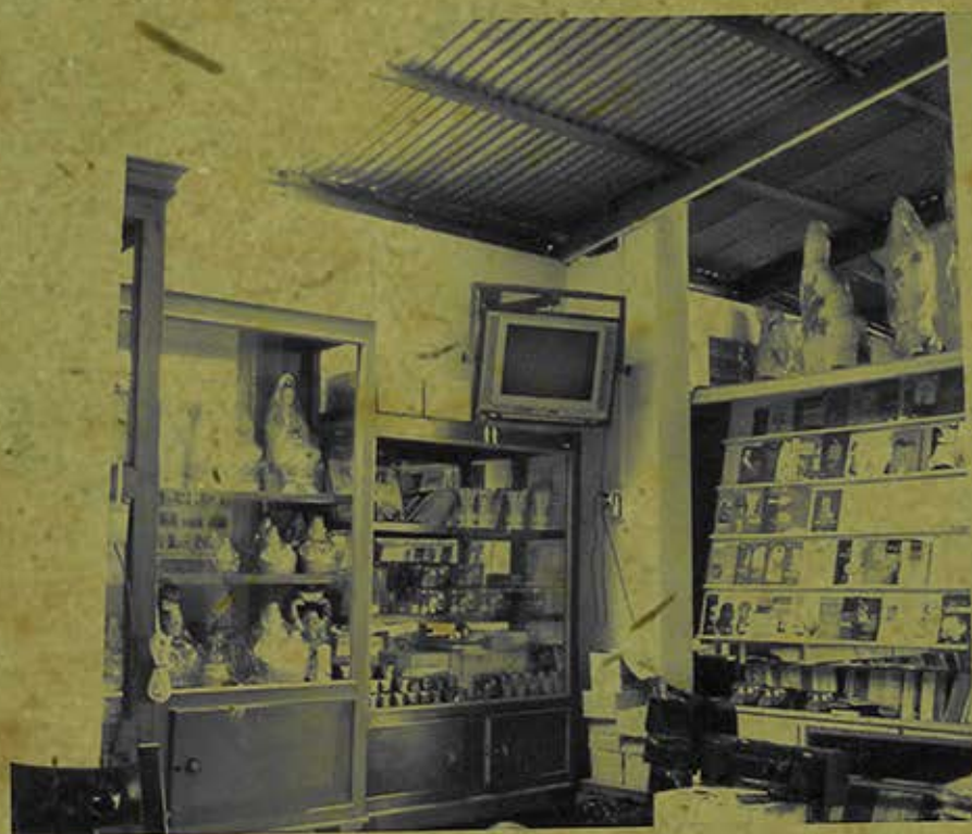
Phòng phát hành kinh sách chùa Viên Quang (An Giang). (Ảnh chụp năm 2007)