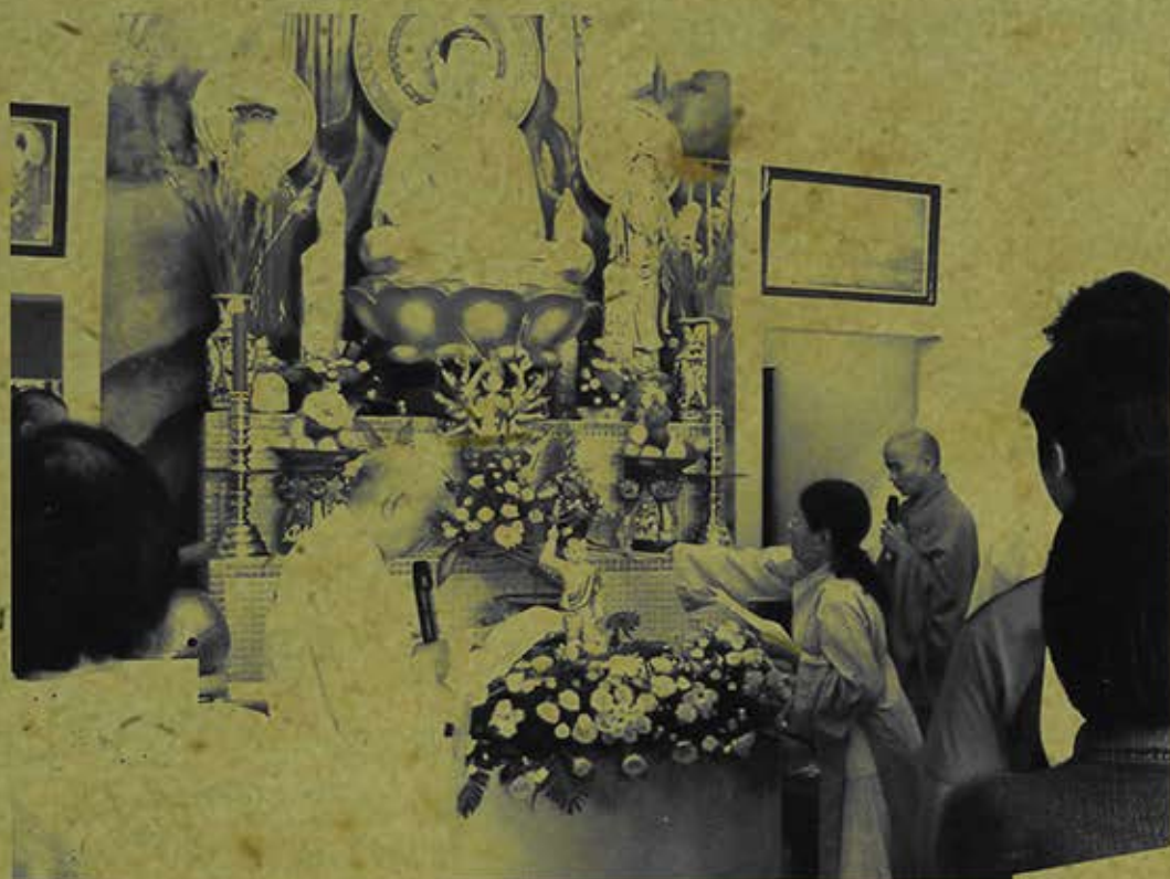
Lễ tắm Phật, ngày Phật Đản, Phật Lịch 2552, chùa Huyền Trang (quận Tân Bình – Tp.HCM). (Ảnh chụp năm 2008)