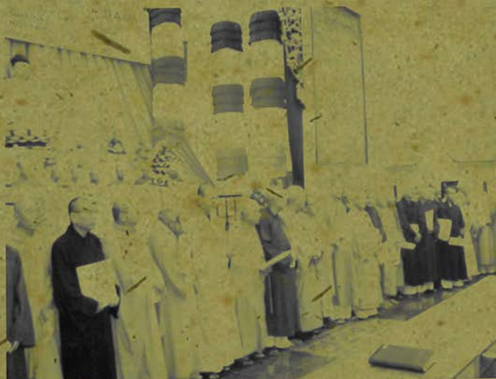
Lễ ra mắt Ban Từ thiện - xã hội Tp.HCM.