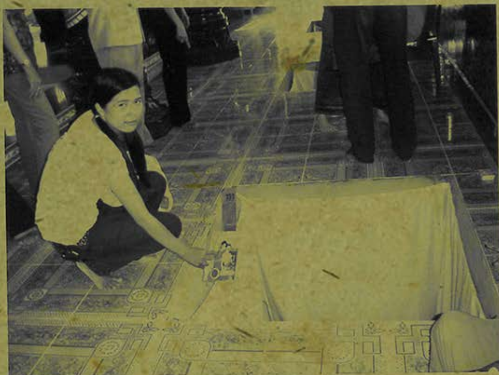
Cô gái Khmer bỏ tập sách vào lỗ seima để cầu học giỏi. (Ảnh chụp năm 2009)