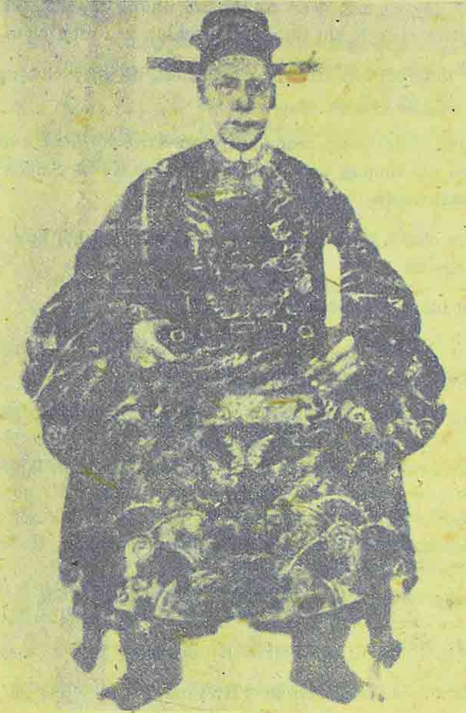
Cơ Mật viện tham tá sung Hàn lâm viện thị giảng học sĩ.