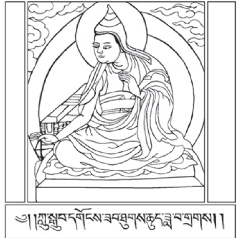
Ngài Nguyệt Xứng (Candrakīrti - thế kỉ 6-7) - luận sư vĩ đại, tác giả Minh cú luận và Nhập Trung quán luận.