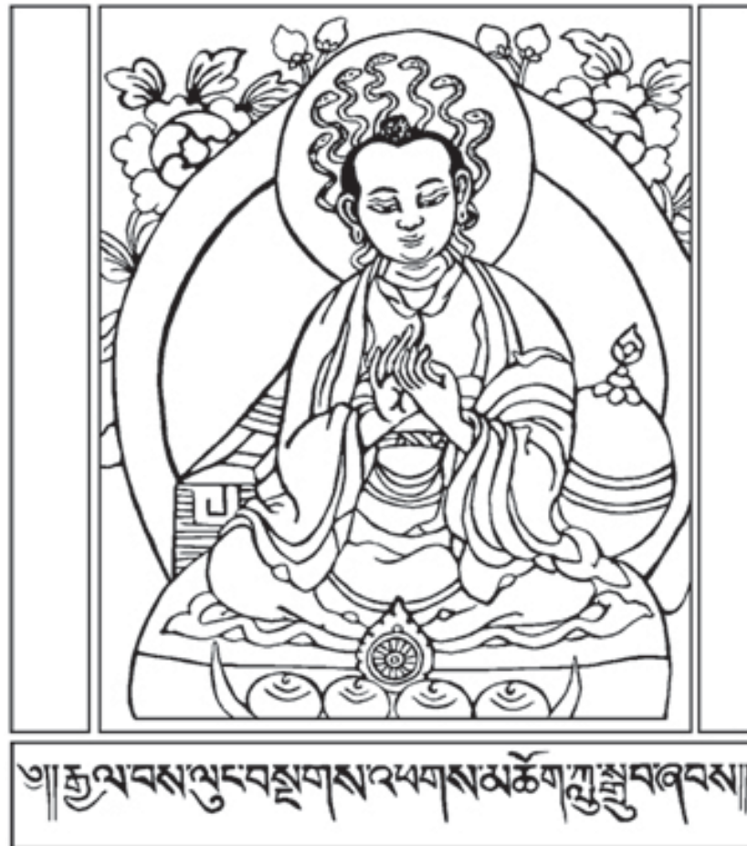
Thánh giả Nāgārjuna (Long Thu) thế kỉ 1-2 - người sáng lập Trung quán tông, tác giả Căn bản Trung quán luận.