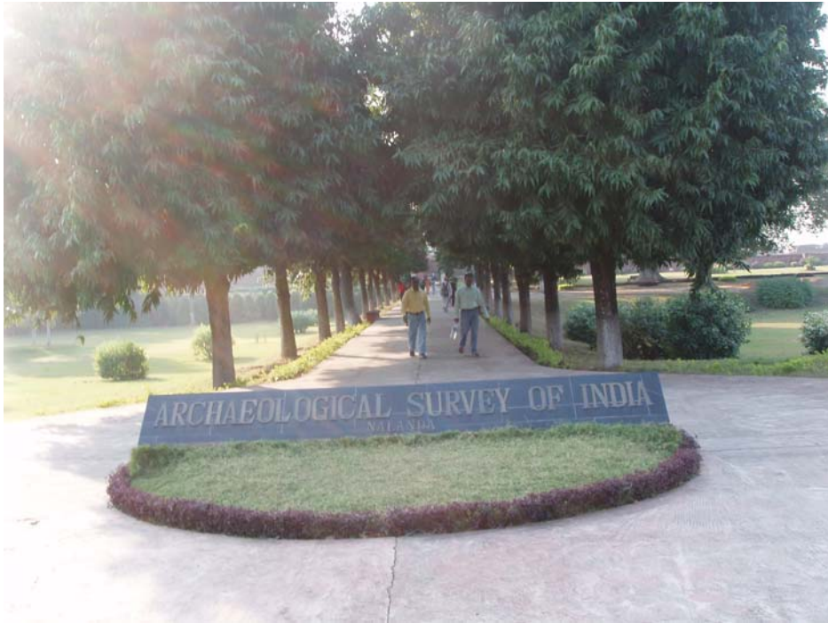
(Đường vào khu phế tích Na Lan Đà)