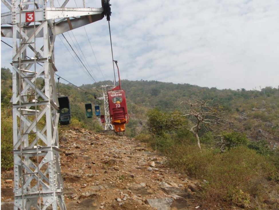
(Cable lên núi Kỳ Xà Quật-Linh Thiểu)