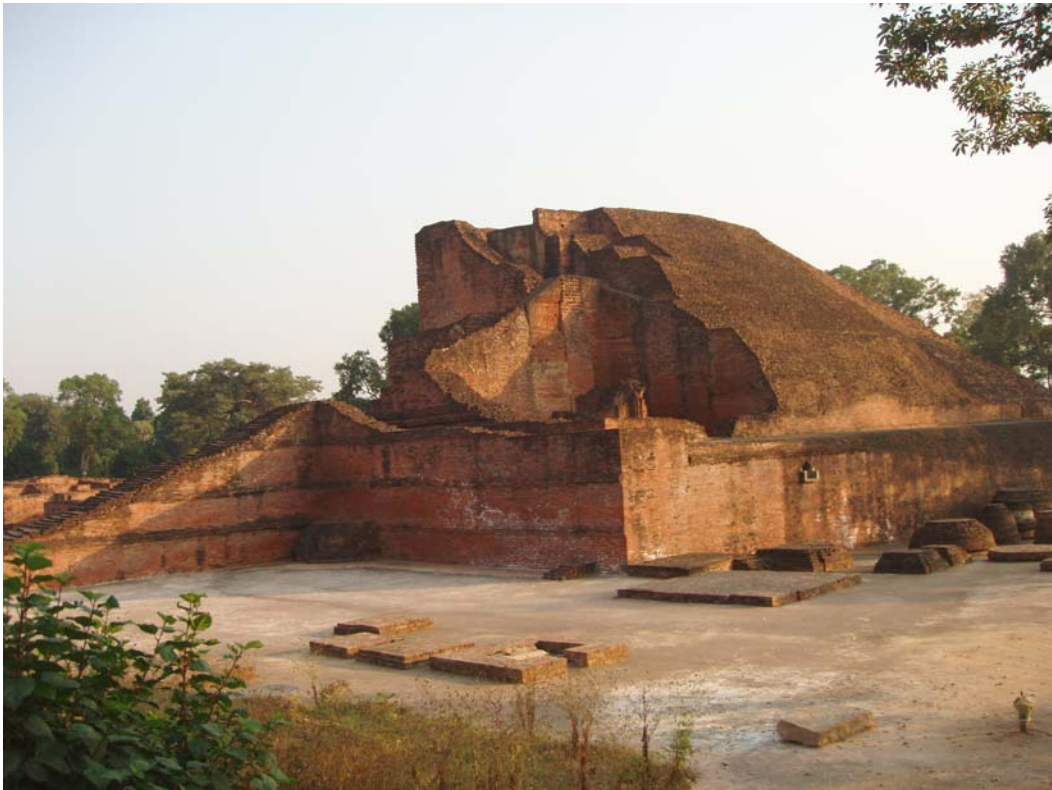
(Khu tháp bị tàn phá trong Na Lan Đà)

(II) Chi tiết về Pháp Giới Bồ Tát—Details of the Dharma Realm of Bodhisattvas: See Chapter 172.