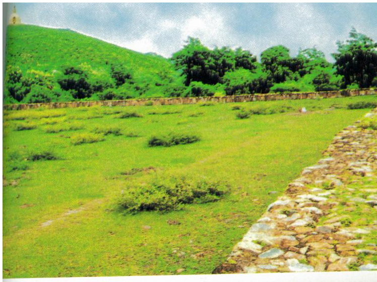
(Nền ngục nơi A Xà Thế giam vua cha Bình Sa Vương trong thành Vương Xá—Bimbisara's Jail in Rajgir)

Thế nào gọi là sám? Thế nào gọi là hối? Sám là sám những lỗi về trước, từ trước có những nghiệp ác ngu mê, kiêu cuồng, tật đố, vân vân, các tội thấy đều sám hết, hằng không khởi lại, gọi đó là sám. Hối là hối những lỗi về sau, từ nay về sau có những nghiệp ác ngu mê, kiêu cuồng, tật đố, vân vân, các tội nay đã giác ngộ, thấy đều hằng đoạn, lại không tạo lại, ấy gọi là hối, nên gọi là sám hối. Người phạm phu ngu mê, chỉ biết sám lỗi trước, chẳng biết hối lỗi sau, do vì không hối nên tội trước chẳng diệt, lỗi sau lại sanh. Tội trước đã chẳng diệt, lỗi sau lại sanh, sao gọi là sám hối được—What is repentance and what is reform? Repentance is to repent of past errors, to repent so completely of all bad actions done in the past out of stupidity, confusion, arrogance, deceit, jealousy, and other such offenses, that they never arise again. Reform is to refrain from such transgressions in the future. Awakening and cutting off such offenses completely and never committing them again is called repentance and reform. Common people, stupid and confused, know only how to repent of former errors and do not know how to reform and refrain from transgressions in the future. Because they do not reform, their former errors are not wiped away, and they will occur in the future. If former errors are not wiped away and transgressions are again committed, how can that be called repentance and reform?”