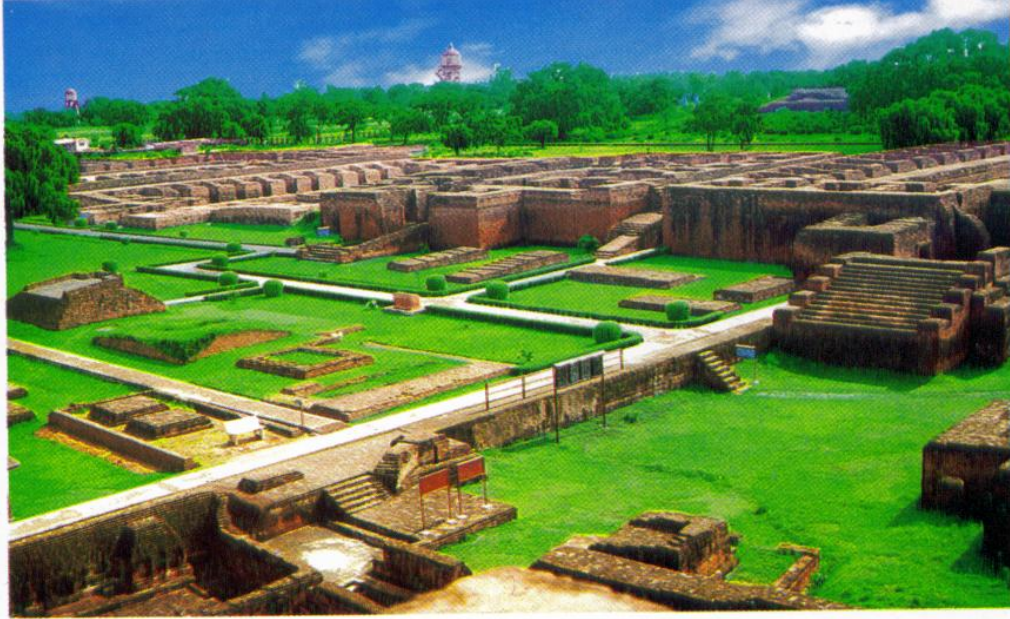
(Phế tích trường Đại Học Na-Lan-Đà Ruins of Nalanda University )