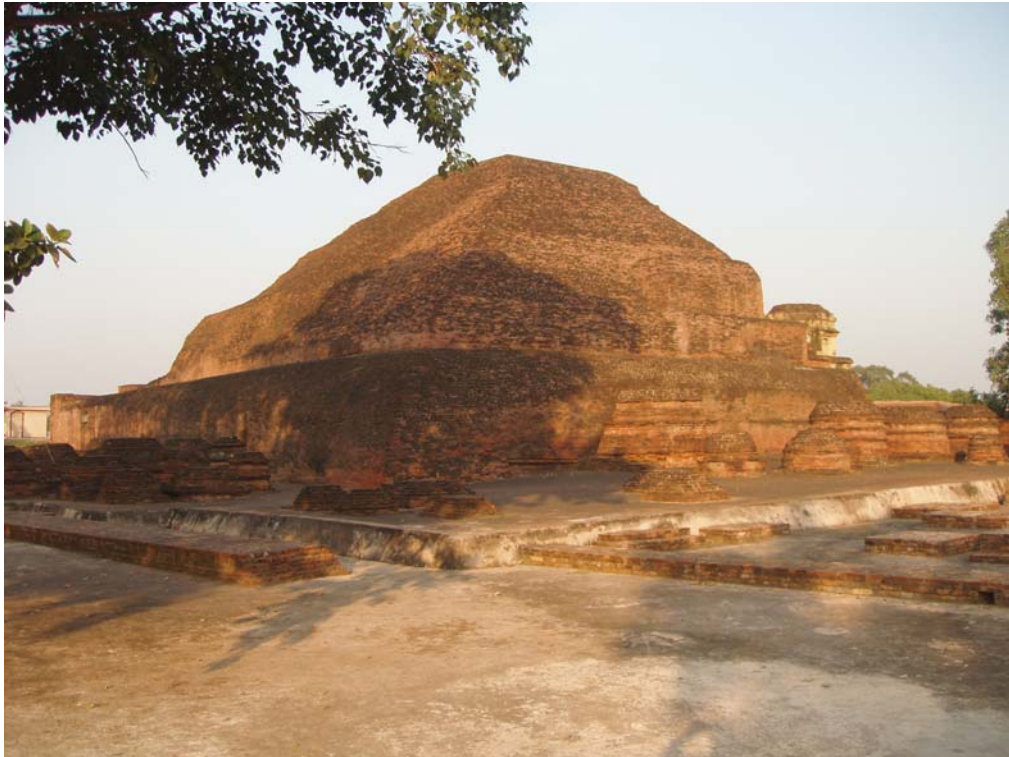
(Phế tháp lớn còn lại trong khu Na Lan Đà)