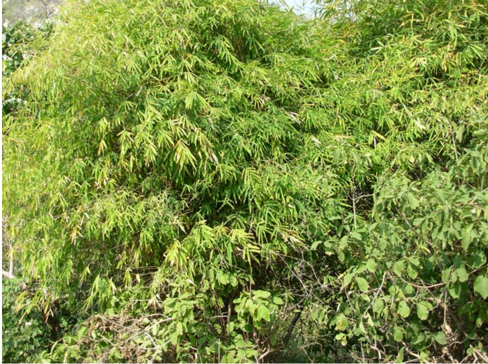
(Từ trên cable nhìn xuống dưới khu thung lũng Kỳ Xà Quật)