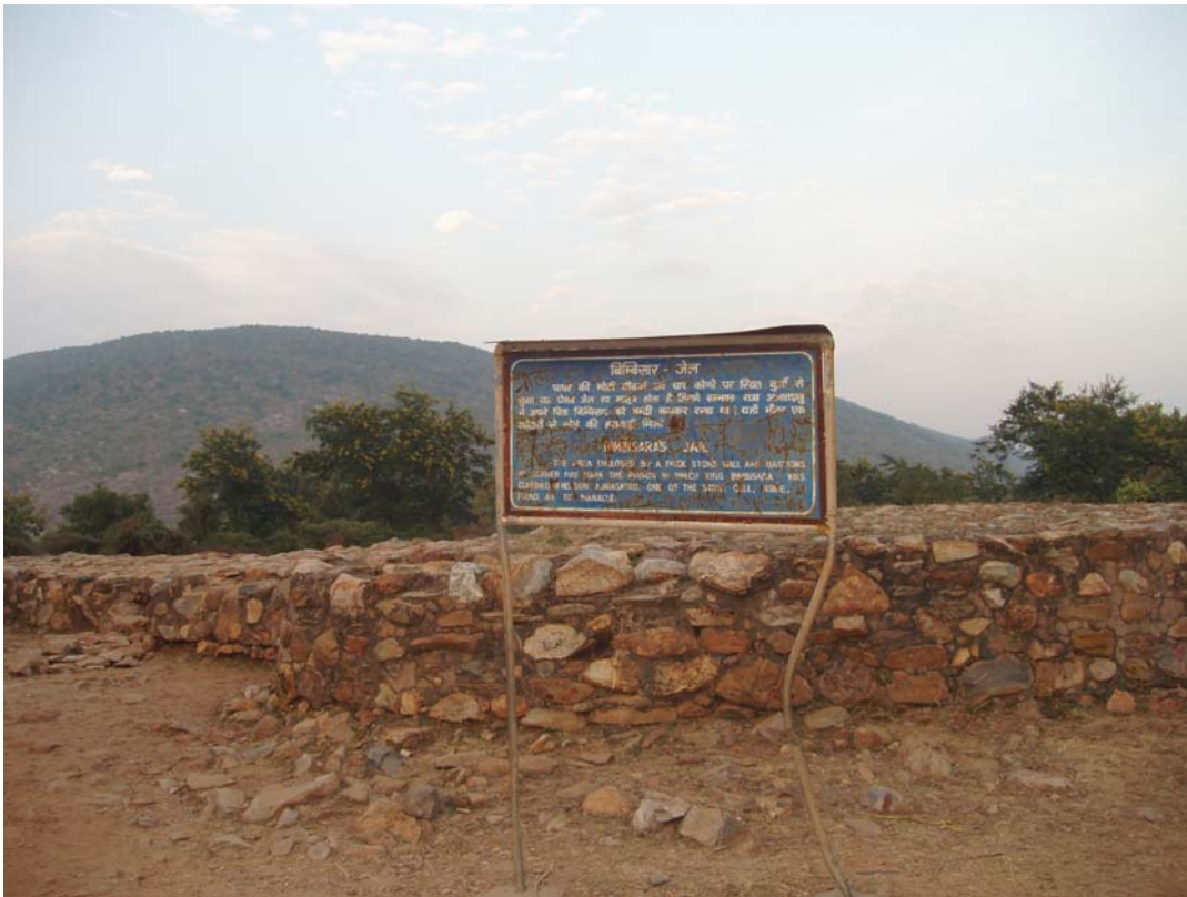
(Phế tích ngục giam vua Bình Sa Vương)

(III) Đức Phật kết luận về Con Người Suy Đồi—The Buddha's Conclusion of the Falling Man: Phật tử thuần thành nên thấu rõ những nguyên nhân đưa đến tình trạng suy đồi trên thế gian để theo gương bậc Hiền Trí Cao Thượng sống với trí tuệ trong cảnh giới nhàn lạc—Sincere Buddhists should know well these causes of downfall in the world and should be able to follow good example of the Noble Sage to endowed with insight and to shares a happy realm.