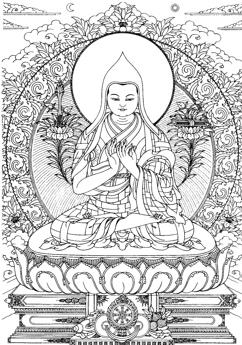
Lama Tông Khách Ba [Lama Tsong Khapa]