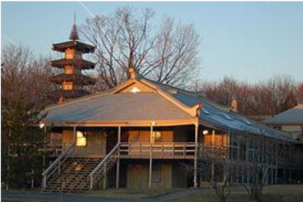
Trung tâm Thiền Quốc tế Providence trong mùa Kiết Đông. Tại Cumberland, Rhode Island, Hoa Kỳ.

Tăng thống Phật giáo Cam Bốt Samdech Preah Mahà GHOSANANDA, Trung tâm Thiền Providence Cumberland, Rhode Island. Hoa Kỳ Ngày 24 tháng 04, năm 1997