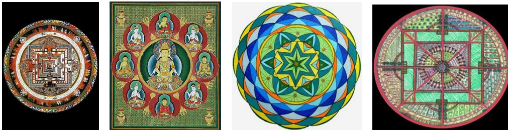
Vài thí dụ về mạn-đà-la (do người dịch thêm vào)

Biểu tượng tỏa rộng sự toàn vẹn của nó dưới tất cả mọi thể dạng, thí dụ như biểu tượng gọi là mạn-đà-la chẳng hạn. Mạn-đà-la biểu trưng cho sự quán thấy về thế giới trong thể dạng đồng nhất của nó. ( mạn-đà-la là một thuật ngữ dịch âm từ tiếng Phạn mandala, có nghĩa là một vòng tròn, nếu hiểu rộng ra thì có thể xem đây là một bầu không gian biểu trưng cho một sự thiêng liêng mang tính cách vừa tượng hình lại vừa trừu tượng, dùng làm nền tảng trợ giúp cho việc thiền định hay sự quán thấy ).