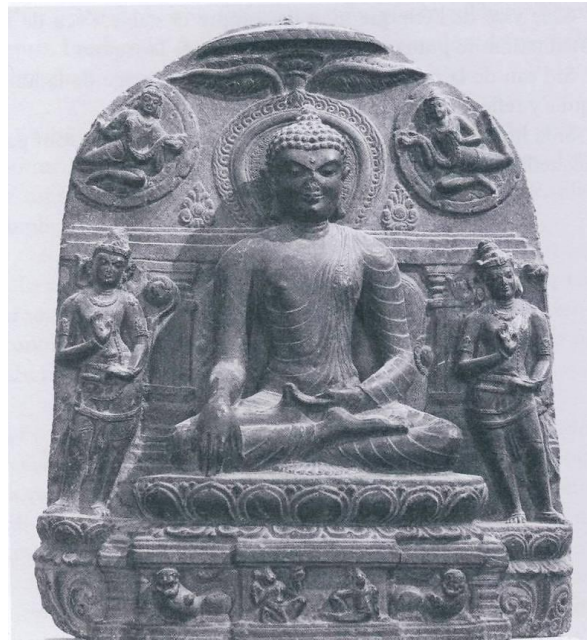
Đức Phật chạm tay xuống mặt đất để chứng minh cho sự chiến thắng của mình trước bọn ma vương (điêu khắc nổi thuộc triều đại Pala-sena, Ấn Độ, thế kỷ thứ X, đá Basalt màu đen, bảo tàng viện Guimet-Paris)