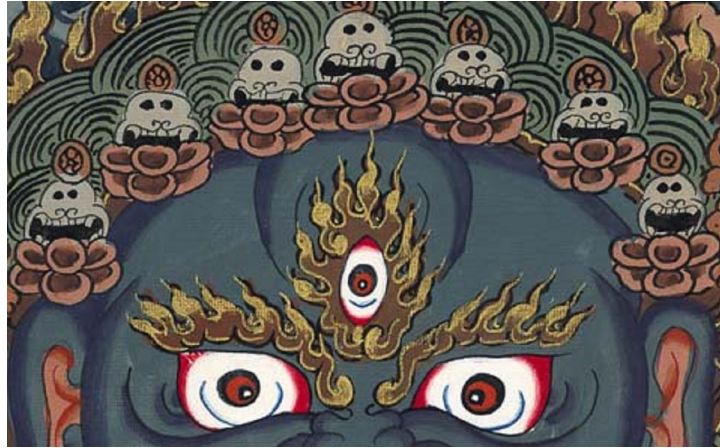
Vương miện của Yama

Chúng ta thường thấy Yama hay xuất hiện trong thangka với một phối ngẫu của mình, Chamundi, là người dâng cho Yama một chén tiên được máu quỷ ( cam lô máu-nd ). Và những xác người chết như là thứ trang sức của Yama. Yama có màu xanh đen của đầu con trâu.