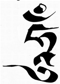
Chúng tự Hum của Tây Tạng

Ngài Avalokiteshvara buồn bã, trong khoảng thời gian 7 ngày. Ngài nghĩ rằng trên thế giới đầy những chúng sanh đau khổ cần một kết quả thật nhanh chóng mà không phải có quá nhiều nỗ lực. Sau đó ngài muốn biến mình thành một bốn tôn phẫn nộ để đánh bại nhanh chóng và hiệu quả hơn những trở ngại cho hạnh phúc của người khác. Với tư tưởng này chữ Hum màu xanh đậm xuất hiện từ trái tim ngài. Chúng tự Hum đó đã trở thành Mahakala. Điều đó có nghĩa rằng trong câu thần chú “ Om Mani Padme Hum ”, chúng tự Hum tượng trưng cho sức mạnh, quyền năng.