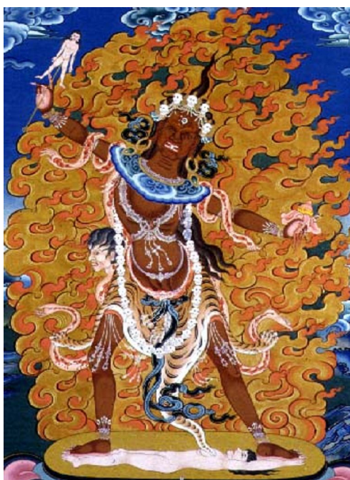
Ekajati - Bà mẹ khùng khiếp

Thất vọng vì sự bại trận của mình, ngài lại tiếp tục cuộc hành trình của mình trong vũ trụ. Ngài bắt đầu giết tất cả những người thanh niên ở những nơi ngài đi qua, và cưỡng bức những cô gái mà ngài gặp. Một ngày nọ ngài gặp nữ thần Ekajati. Với ý định quấy rầy nữ thần, ngài bắt đầu buông lời ong bướm. Nữ thần Ekajati nổi giận và dùng chiếc khăn tơ lụa của mình đang choàng trên người để đánh ngài.