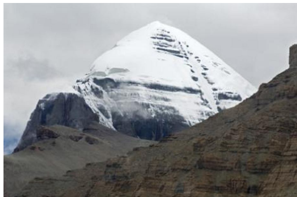
Ngọn núi Kailash

Nơi ở của Kubera là ngọn núi Kailash ( một đỉnh núi linh thiêng, mà người dân Tây Tạng rất hay hành hương tới, tương truyền ai tới được ngọn núi linh thiêng này thì dường như đã tịnh hoá được rất nhiều nghiệp lực, cũng như đã tiến một bước rất dài trong con đường tu tập - người dịch ). Nhưng khi được Brahma bổ nhiệm làm Thần Tài Bảo, thì Brahma cho ngài vùng Lanka ( Ceylon) làm thủ phủ của ngài.