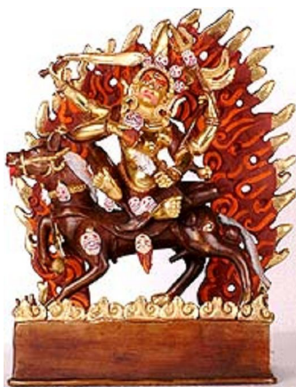
Tôn tượng của Palden Lhamo

Ngoài ra còn có một truyền thuyết nói rõ hơn về sự từ bi của ngài. Tương truyền là ngài đính hôn với một vị vua tên là Shenji, người vừa là một vị vua khát máu vừa là một chiến binh bạo tàn, ông ta từ chối hết những lời yêu cầu của Palden Lhamo khẩn cầu ông đừng giết hại dân chúng vô tội. Cuối cùng ngài đành đưa ra một tối hậu thư :