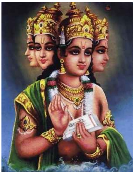
Hình tượng Brahma trong Hindu giáo

Brahma (Phạm Thiên) , là một vị thần quan trọng nhất đối với đạo Hindu, tuy nhiên đối với Phật giáo thì Phạm Thiên chỉ chiếm một vị trí thứ yếu. Tên tiếng Tây Tạng của Brahma là Tshangs Pa, chúng ta thường biết đến Brahma với hình tượng 4 đầu 2 tay. Nhưng trong Phật giáo Tây Tạng ngài luôn được biểu hiện với màu trắng, 1 đầu 2 tay và được gọi là Tshangs pa dkar po. Có nghĩa là Tshangs Pa Trắng.