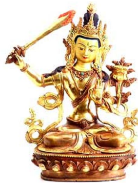
Bồ Tát Văn Thù Sư Lợi

Người dân Tây Tạng nguyện cầu đức Văn Thù Sư Lợi, xin ngài bảo vệ dân chúng trước cuộc báo thù của Yama. Văn Thù Sư Lợi liền vận dụng thần thông hoá thân thành Yamantaka (Hàng phục dạ ma), ngài đánh bại Yama, để cứu giúp dân chúng, đồng thời ngài khiến Yama trở thành một trong những hộ pháp của Phật giáo.