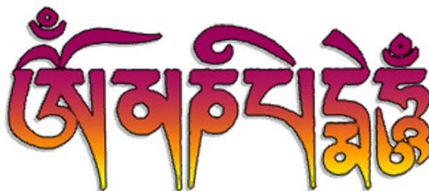
Thần chú Om Mani Padme Hum

Sự xuất hiện của Mahakala kéo theo sự rung động của mặt đất, đồng thời có giọng nói của chư Phật vang vọng trong không trung chứng minh rằng Mahakala có đủ quyền năng làm ban phát những gì chúng sinh mong muốn nếu những mong muốn đó là trung thực và tốt.