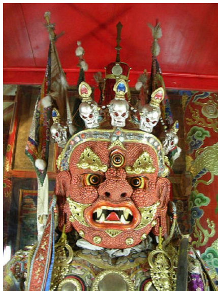
Chân dung của Begtse

Ngài xuất hiện với đầy đủ các thứ phục trang như các hộ pháp khác, giơ cao một thanh gươm ( cán gươm có hình con bò cạp ) trong tay phải. Tay trái thì nắm một chiếc đầu của kẻ thù màu cam, ta còn có thể thấy ngài giương cung tên cùng lúc đó. Ngài đạp lên xác chết của người đàn ông bằng chân trái, chân còn lại thì ngài dẫm lên cái xác chết của con ngựa. Ba con mắt của ngài đầy sự phẫn nộ, nhìn trừng trừng đủ để đe dọa những kẻ phá hoại chánh pháp.