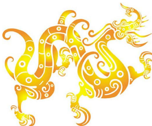
Rồng ( một dạng của naga )

Hayagriva là một hoá thân phần nộ của đức Avalokiteshvara ( Quan Thế Âm ), theo những khảo cứu thì có tới 108 hình tướng của Hayagriva. Năng lực đặc biệt của ngài là chữa bệnh, nhất là các bệnh về da, thậm chí cả những bệnh về da khá trầm trọng như là bệnh phong. Bệnh này được tin rằng do Naga gây ra ( Naga là loài rồng nhưng có hình tướng giống như rắn, rất thích sống ở khu vực sông nước, ao hồ, biển cả... nd )