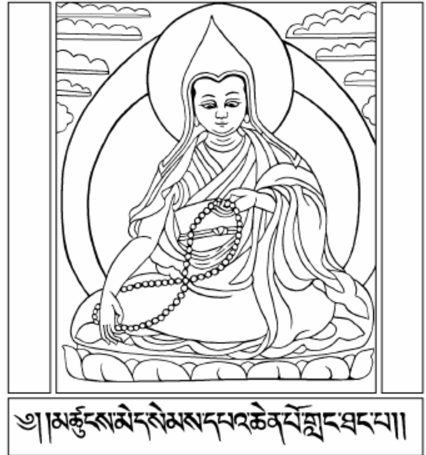
Langri Tangpa Dorje Sengge

2. Trong phần căn cơ thấp của Lam-rim, người tu quán tưởng mình sinh vào một cõi ác đạo, thấy mình sống trong cảnh sống đó để phát sinh lòng sợ hãi chính đáng, quyết tâm không trở lại cõi tái sinh như vậy nữa bằng cách qui y Tam Bảo và sống thuận luật nhân quả.