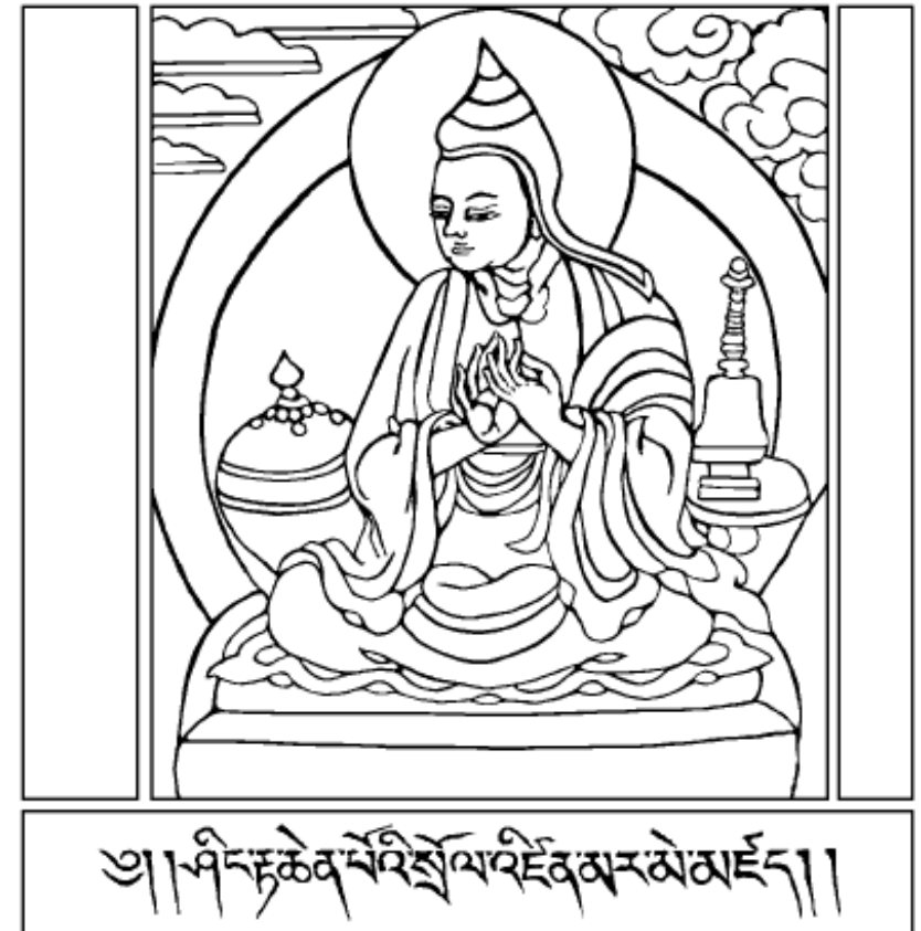
Thánh Atisha (980-1052)