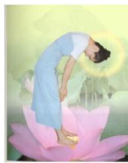
Thả lỏng hai vai