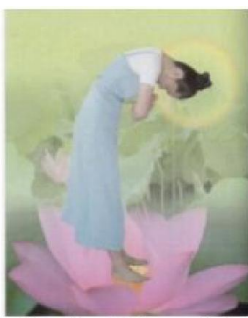
Cúi đầu & khom mình