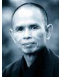
HT Nhất Hạnh