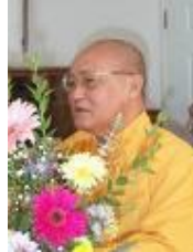
HT Nhật Quang