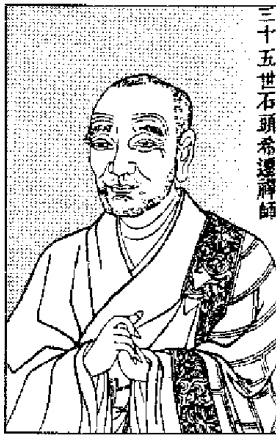
Sekitō Kisen (Shitōu Xiqian)

Thiền sư Thạch Đầu Hy Thiên (tên Trung hoa: Shitōu Xiqian, tên Nhật: Sekitō Kisen, 700-790, có nơi ghi là 695-785), lúc mới xuất gia đã đến xin thọ giáo Lục tổ Huệ Năng, tuy được chấp nhận nhưng không bao lâu thì Lục tổ tịch nên theo lời chỉ dẫn của Lục tổ, đến thọ giáo thiền sư Hành Tư tại núi Thanh nguyên.