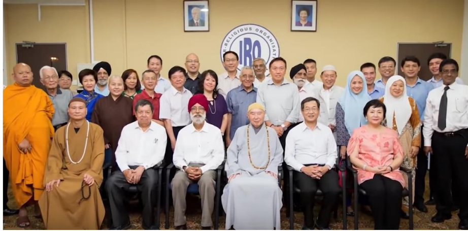
Dưới đây là hình Ngài tại giảng đường khai thị về văn hóa đạo đức truyền thống.