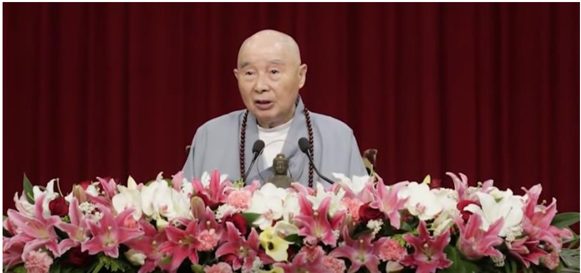
Đây là tại buổi trình chiếu kết quả của cuộc thí nghiệm kết tinh của nước được thực hiện bởi phòng thí nghiệm Hoa Nghiêm.