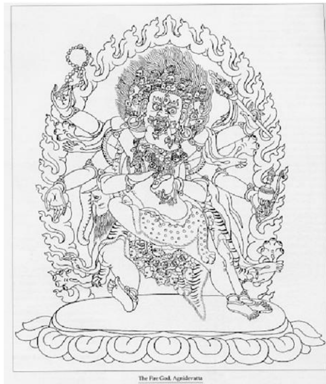
Hình 2 : Thần Lửa (Agnidevatta)

Mục đích chung của cúng dường các thức là để tiêu trừ các chướng ngại ngăn che giác ngộ bằng cách tẩy sạch các vết ô nhiễm gây ra từ các ác