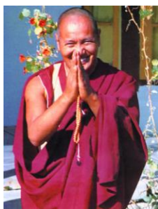
Lạt Ma Yeshe

Tiểu sử ngài đã được nói trong cuốn Dẫn nhập vào Năng lực Trí tuệ, một loạt bài chọn lọc từ những buổi giảng nhân dịp ngài viếng thăm Bắc Mỹ cùng với Lama Thubten Zopa Rinpoche. Ở đây chỉ xin nhắc lại vài điểm vắn tắt. Lama Yeshe ra đời ở Tolung gần Lhasa vào năm 1935, sáu tuổi đã vào tu viện Sera, ở đây ngài được hấp thụ một nền giáo dục rộng rãi về thế học và phật học. Sau khi Tây tạng bị chiếm năm 1959, ngài hoàn tất việc học ở trại tị nạn Buxaduar đông nam Ấn, và đi định cư gần tháp Boudhanath, ngoại biên Kathmandu, Nepal. Ở đây ngài khởi sự tiếp xúc nhiều người tây phương. Năm 1971 ngài cùng Lama Zopa sáng lập trung tâm Tu viện Đại thừa trên đỉnh đồi Kopan, tổ chức những khóa giảng hàng năm lôi cuốn học viên ngày càng đông. Những học viên này về sau đã mở thêm hơn ba mươi trung tâm tu học. Trong mười năm cuối đời, Lama Yeshe thường lui tới những trung tâm này để diễn giảng, tổ chức các khóa huấn luyện lãnh đạo, và quan trọng hơn cả, gây cảm hứng cho mọi người, làm tấm gương thân giáo về hạnh lợi tha không mỗi mảy. Cuối cùng, vào ngày 3 tháng 3 năm 1984, tại bệnh viện Cedars-Sinai ở Los-Angeles, vào sáng sớm đầu năm âm lịch, ngài viên tịch vì chứng suy tim trầm trọng đã trên 12 năm đe dọa mạng sống ngài.