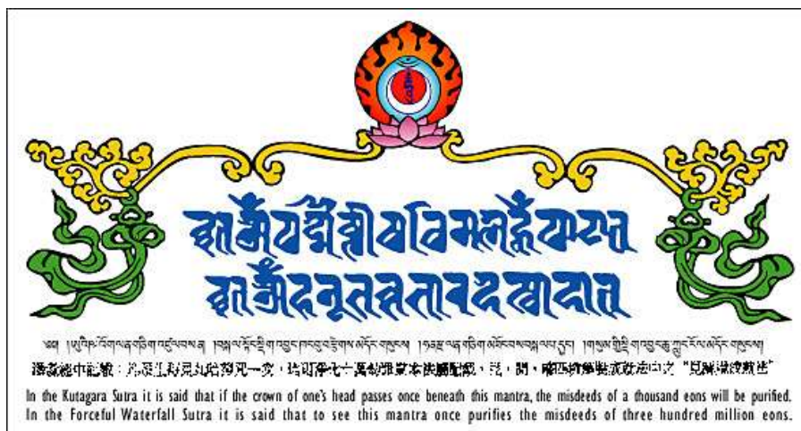
Bản chữ Lantsa