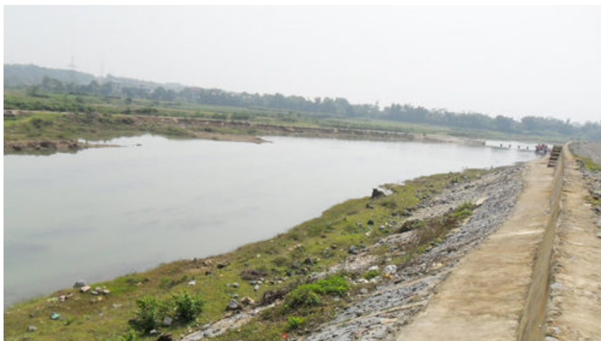
Con sông nơi cháu Tiến chết đuối cách đây 10 năm.

"Tôi lao xuống dòng nước, ôm chặt lấy con nhấc lên bờ. Nhưng tất cả đã quá muộn!", giọng anh lạc đi, không giấu vẻ kinh hoàng khi nhớ về cái ngày đau thương ấy.