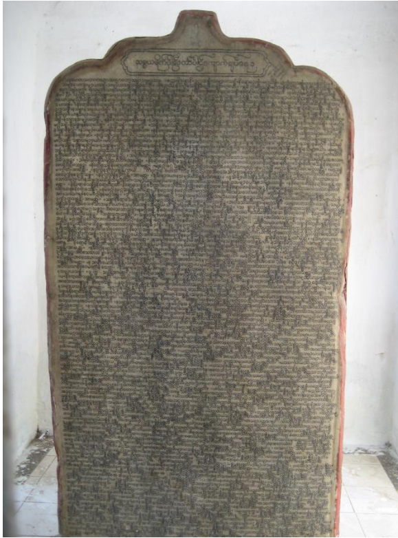
Bức hình của tấm đá cẩm thạch

bạn chắc chắn phải viếng thăm những tấm đá cẩm thạch ấy. Đại hội Kiết tập kinh điển Phật giáo kể trên được tổ chức vào khoảng cùng lúc với năm thứ 2400 sau ngày Đức Phật nhập diệt, tức là vào năm 1871 theo Tây lịch. Và đã có 2400 vị tu sĩ tham dự trong Hội đồng này.