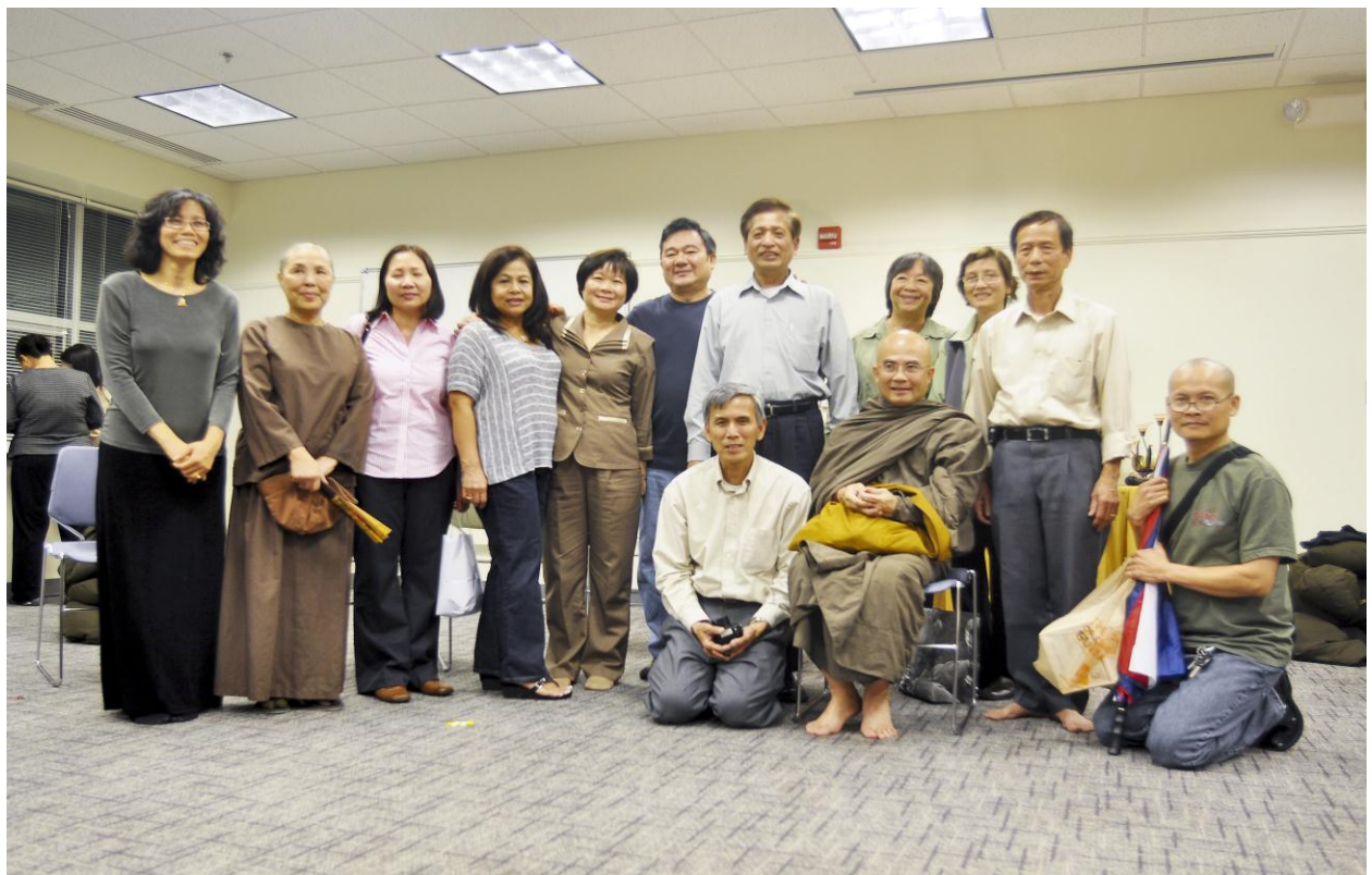
Đại chúng sinh hoạt vui vẻ với nhau trong Ngày Bế Giảng Khóa Học Kinh Pháp Cú.