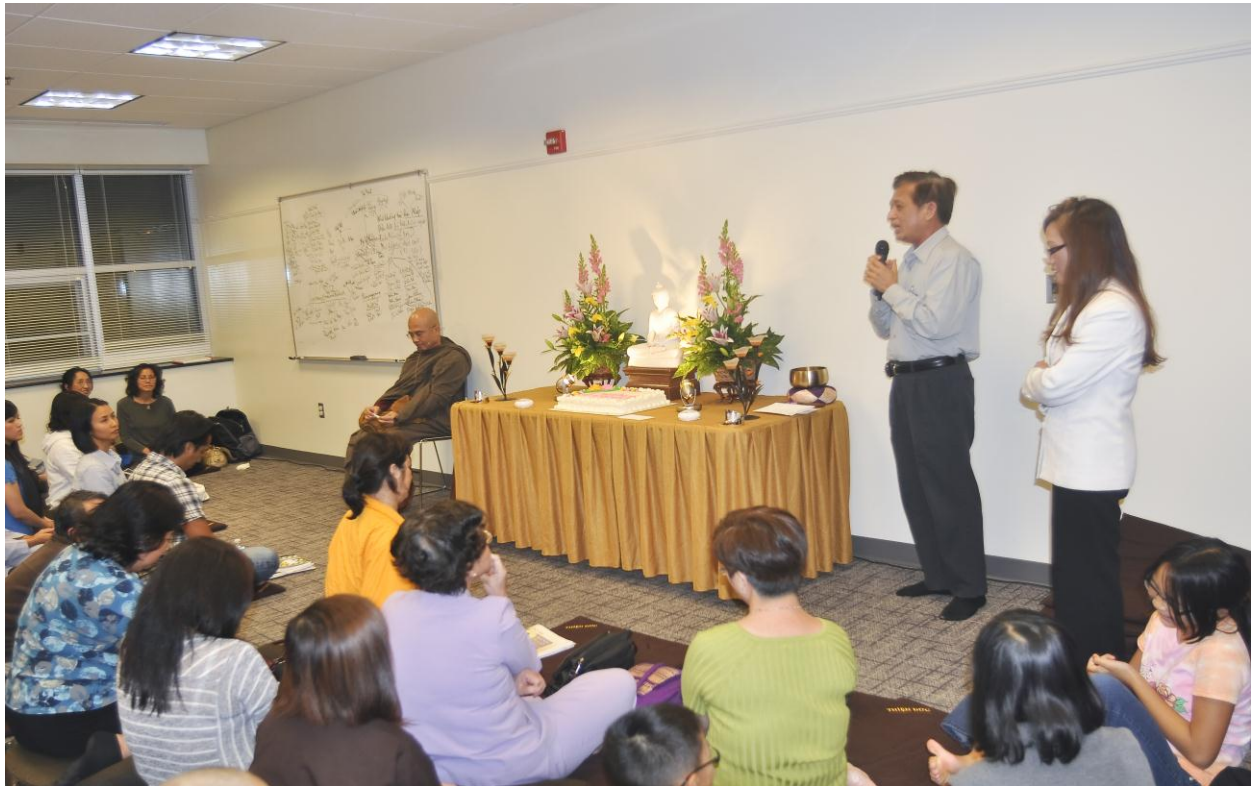
Phật tử Chánh Minh Đạo phát biểu cảm tưởng về Khóa Học Kinh Pháp Cú