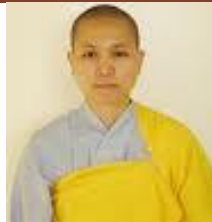
NS Giới Hương