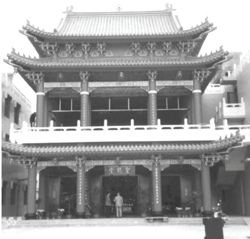
Thánh Hiền Đường ở Đài Trung thuộc Đài Loan