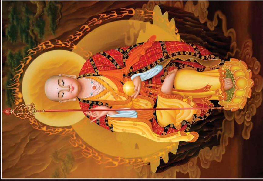
NAM MÔ ĐỊA TẶNG VƯƠNG BỒ TÁT