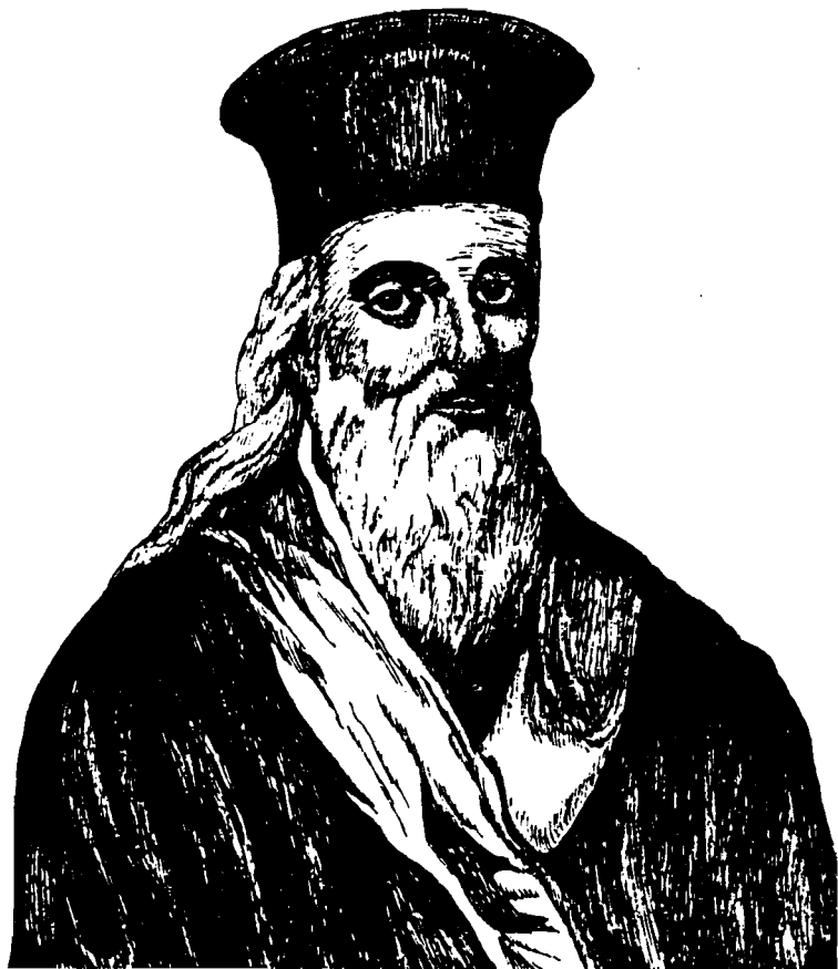
Chân dung Giáo sĩ Alexandre de Rhodes (A-lich-sơn Đắc Lộ 1593-1660)