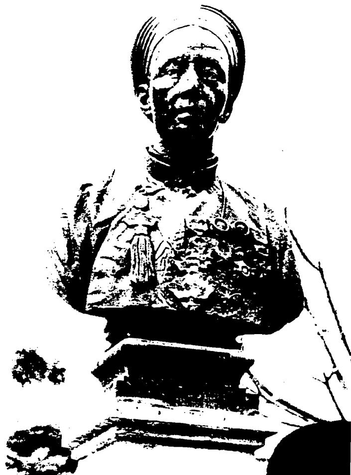
Khổng Mạnh cương thường tu khắc cốt, Tây Âu khoa học yếu minh tâm