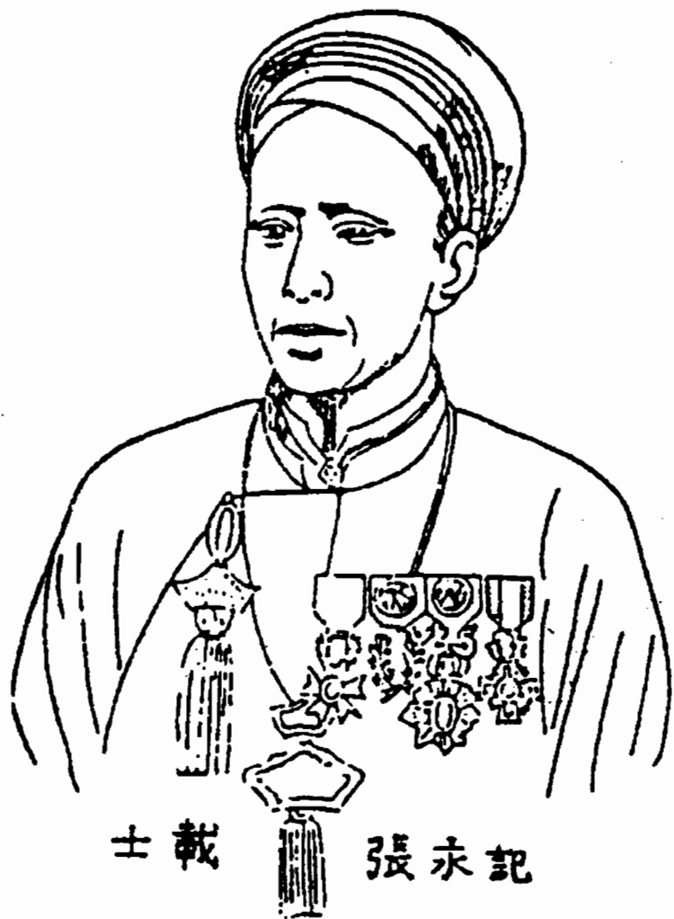
Nhà Bác học Petrus Trương Vĩnh Ký (1837-1898)

Khổng Mạnh cương thường tu khắc cốt Tây Âu khoa học yếu minh tâm