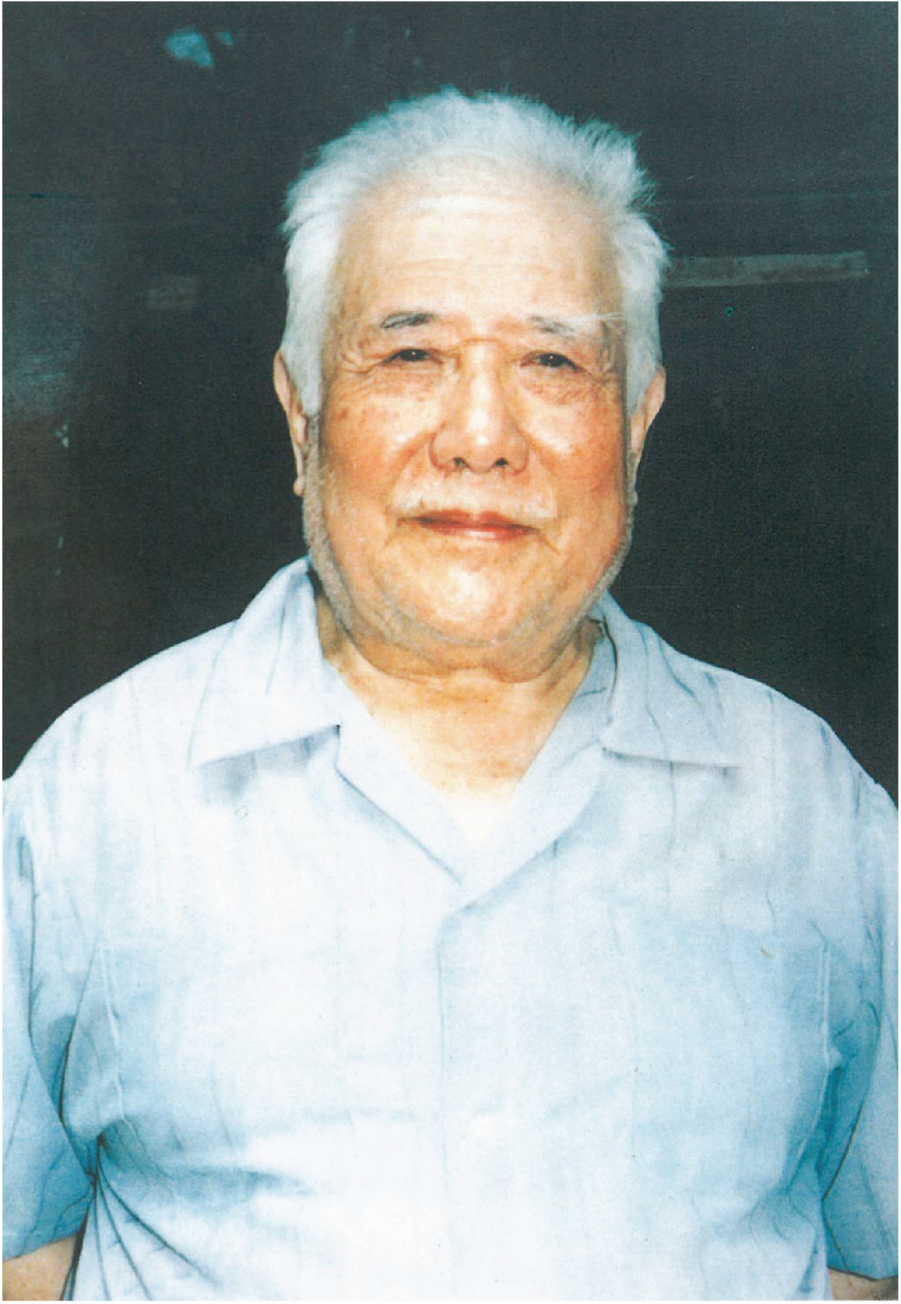
像德士居老祖念黃