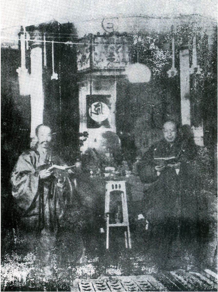
捧各，（左）士居居蓮夏與乃，本會此明證爲，（右）師法老明慧 通俱說宗，優兼解行，範典世爲，真純行志師法老。前佛影攝冊一 門依皈均（居蓮）夏北（義光）梅南斗泰士居。參老爲推齊方諸， 佛入悟示開，玄幽剖直，句文滯不，座餘十四論經乘大講開曾。下 。德大有希代近爲實，見知之