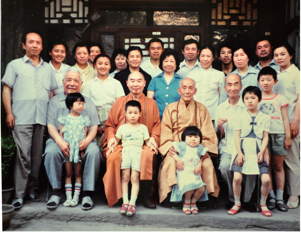
(左) 人上公念與京北問訪 (中) 師法空淨日六十月六年〇九九一 。所寓士居老黃於攝合修同諸暨