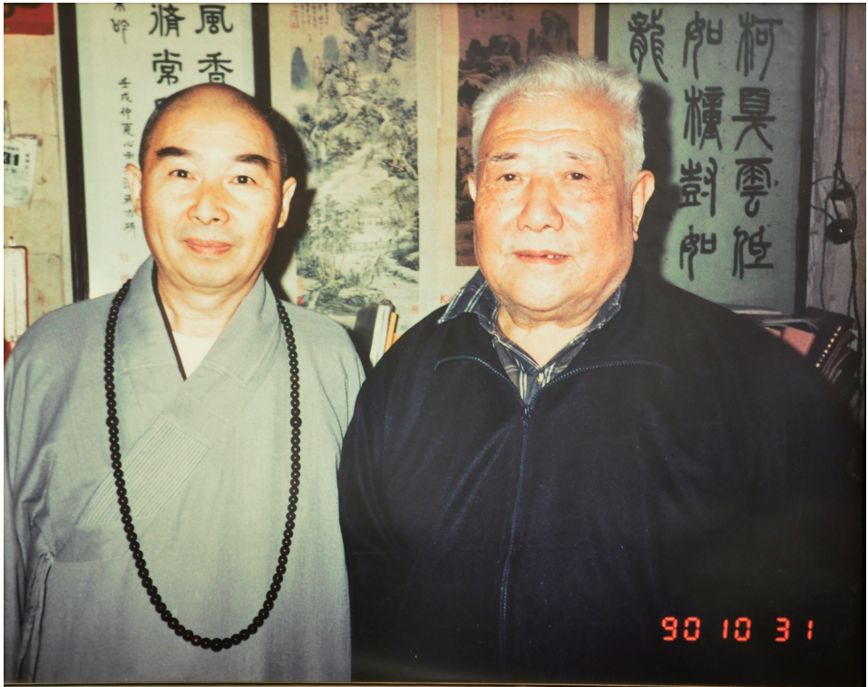
師法老。影合時（右）士居老祖念黃訪探（左）師法老年○九九一 古外中集會，火燈之老夏傳繼，病老懼無人上公念嘆讚及謝感分十 經此。命慧佛續，《經壽量無》解註，部三十九百一疏論、論經今 。典寶有希之度得生眾年千九法末為實註